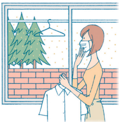
花粉を洗濯物に付着させたくない場合。