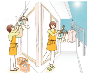
室内物干しを上手に使って、干す時間を短縮。