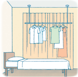
下着など外に干すのが心配な場合。