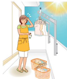
暑い日、寒い日に干すのは大変。